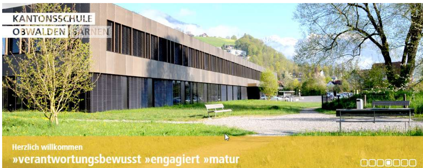
Neues Gymnasium: Hauptgebäude der Kantonsschule Obwalden an der Rütistrasse