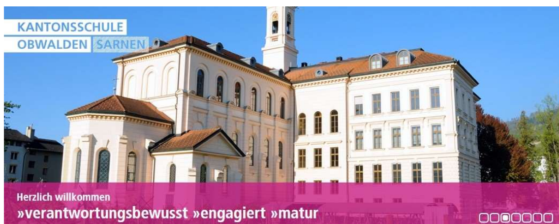
Altes Gymnasium: Musische Ausbildung der Kantonsschule Obwalden an der Brünigstrasse